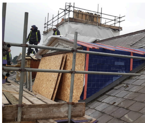
Adnewyddu ffenestri dormer ar flaen yr adeilad