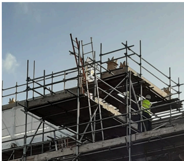
Tynnu simdde o gefn yr adeilad

Cliriwyd mwy ar du mewn yr adeilad. Mae deunyddiau bellach wedi cyrraedd yn barod ar gyfer y gwaith adnewyddu ac adeiladu ym mis Mawrth. Diolch i'r adeiladwyr ac hefyd i'r gwirfoddolwyr sydd wedi rhoi oriau o'u amser i'r fenter.