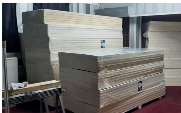
Byrddau inswleiddio yn barod i'w ffitio