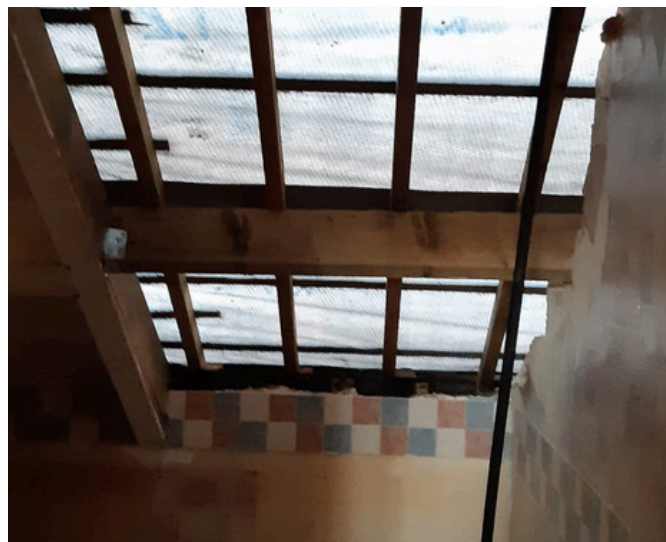
Ffenestri dormer wedi'i tynnu o gefn yr adeilad